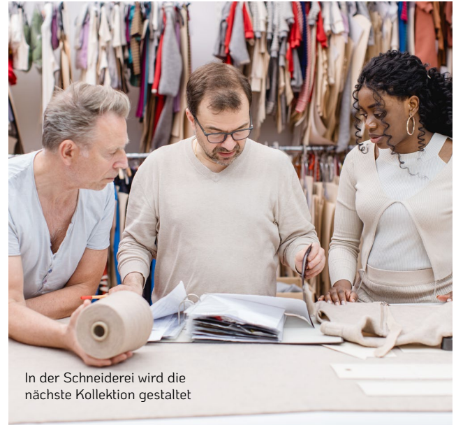
In der Schneiderei wird die nächste Kollektion gestaltet